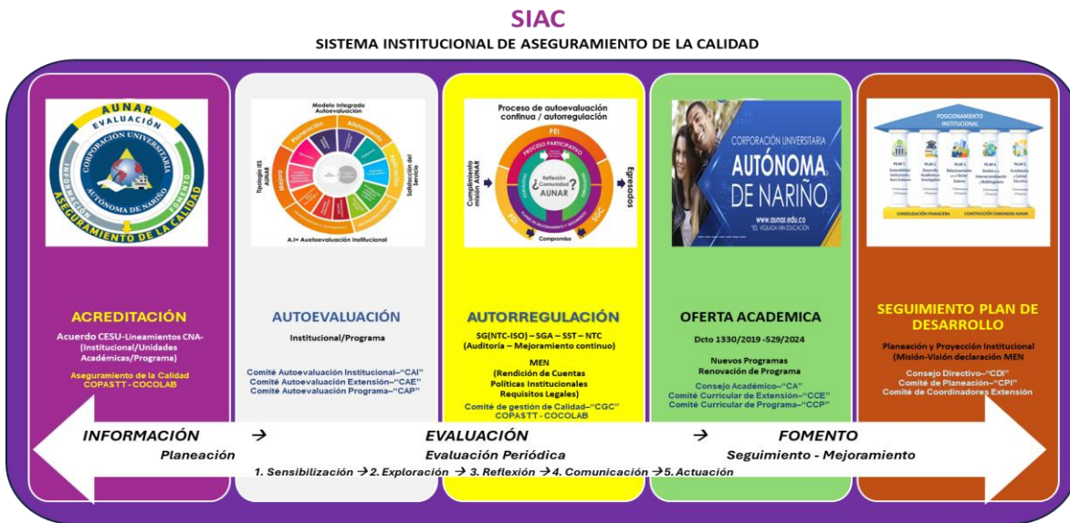
Figura 8. Visualización general del SIAC y su Gestión Institucional desde macroproceso de Evaluación y Autorregulación.

Además, el aseguramiento de la calidad desde la gestión de calidad presenta la relación coherente entre las funciones sustantivas asociadas al servicio educativo y los procesos que facilitan su cumplimiento.