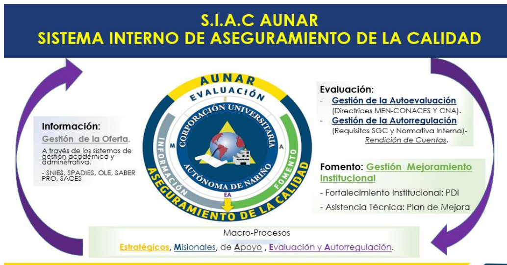
Figura 6. Diagrama de visualización general del SIAC y su articulación con los Procesos de Gestión Institucional.

El Sistema Interno de Aseguramiento de la Calidad – SIAC de AUNAR constituye el conjunto de políticas, procesos, prácticas y herramientas orientadas a garantizar la excelencia académica, la eficiencia administrativa y la pertinencia social de la institución. Este sistema articula la planeación estratégica, la evaluación institucional y el mejoramiento continuo, en concordancia con la normatividad nacional vigente y las políticas de calidad de la educación superior.