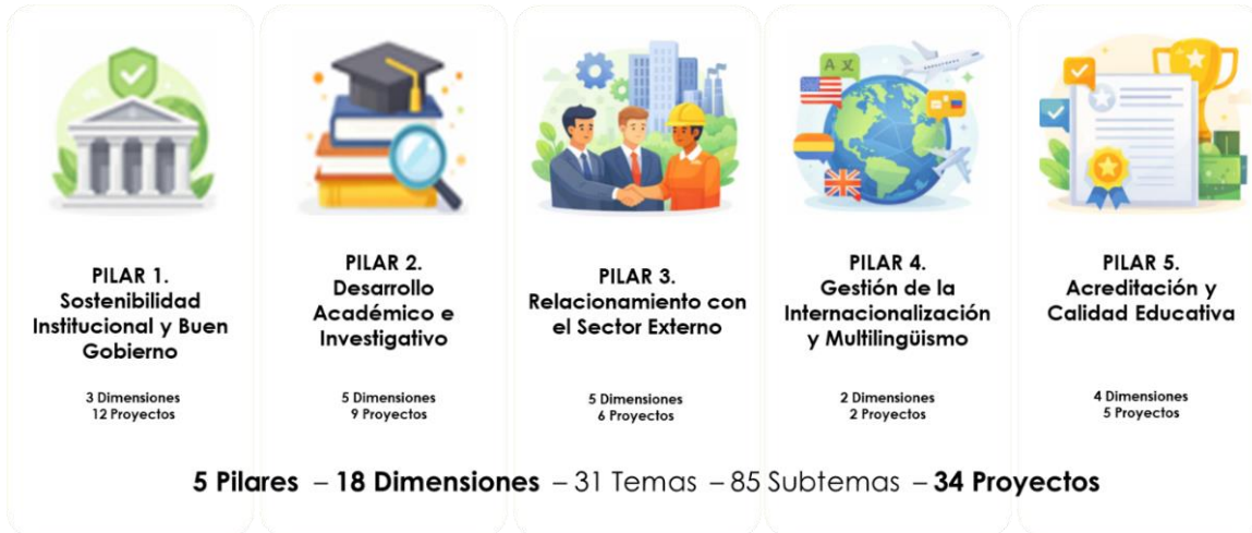
Figura 2. Pilares PDI AUNAR 2024-2033 "Formación, Innovación y Futuro con ADN AUNAR"