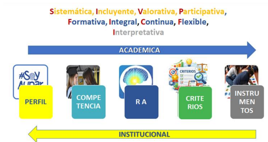
Figura 5. Dinámica de la Evaluación desde el Modelo pedagógico

La Institución desde el modelo pedagógico, propone una evaluación sistemática y continua; integral y flexible; participativa e incluyente; formativa, interpretativa y valorativa , que abarque el inicio, el desarrollo y el final del proceso educativo evidenciado a través de los instrumentos y técnicas de evaluación, desarrollados a partir de los contextos determinados en los criterios de evaluación que reflejan lo requerido por los Resultados de Aprendizaje, que evidencian el alcance de las competencias definidas en el perfil del egresado.