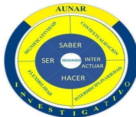
Figura 4. Diagrama del Modelo Pedagógico Integral de la AUNAR

¿Qué es la SIGNIFICATIVIDAD en el desarrollo Curricular?; ¿Cómo interviene la CONTEXTUALIZACIÓN en el desarrollo Curricular?; ¿Cómo se presenta la INTERDISCIPLINARIEDAD en el desarrollo Curricular?; ¿Cómo se alcanza la FLEXIBILIDAD en el desarrollo Curricular?; ¿Cómo se asume el currículo desde la base de la INVESTIGATIVIDAD (con Soporte y enfoque Investigativo) ?, El modelo pedagógico Integral de AUNAR, se estructura a partir de la interacción de 3 entornos y/o contextos formativos (Educativo, Educativo Institucional y el Investigativo).