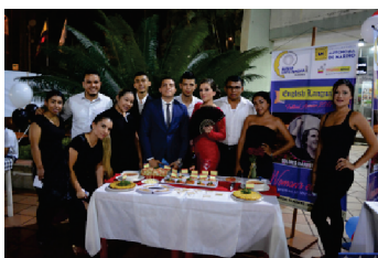
Gastronomías del mundo