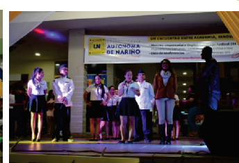
Entrevistas a participantes