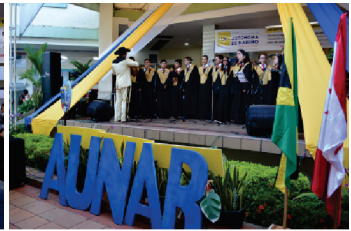
Conciertos musicales Invitados especiales