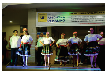
Danzas y coreografías